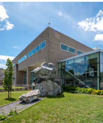
Dany Vachon / ULaval