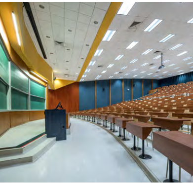
Dany Vachon / ULaval