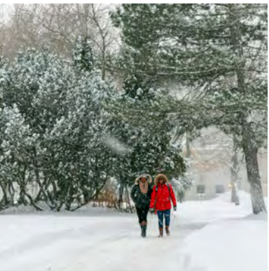
Pub Photo / ULaval