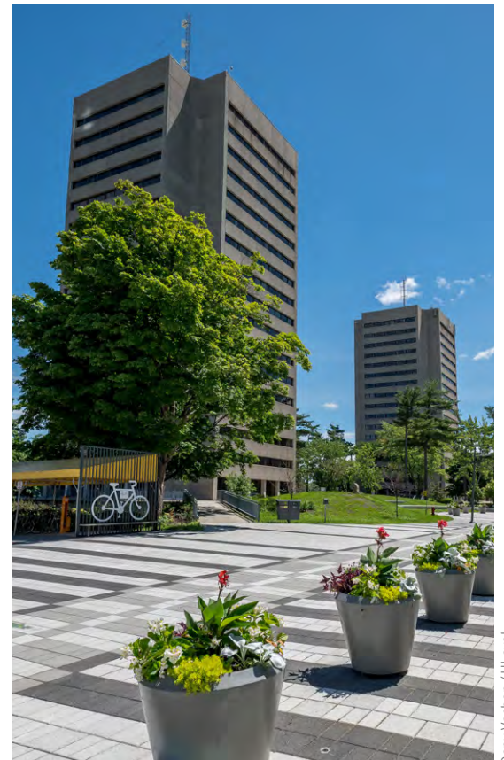
Dany Vachon / ULaval