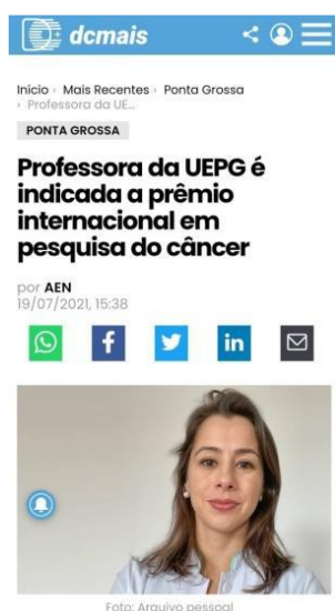
Divulgação em sites locais, externos à universidade