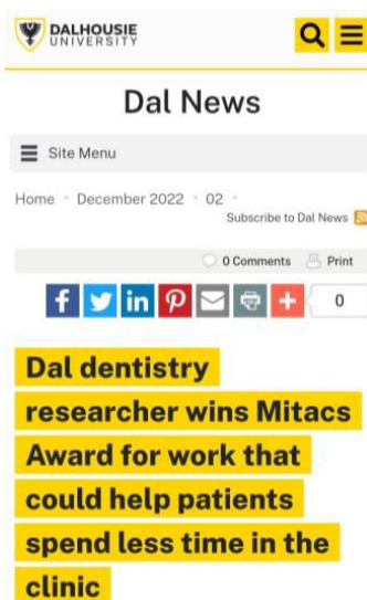
Divulgação em sites internacionais