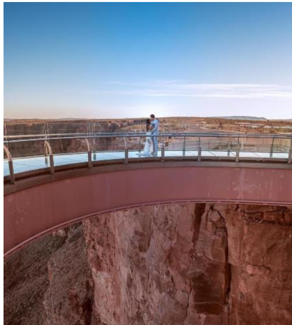
Foto 3 – Renovação de votos de Simaria e seu marido no Grand Canyon