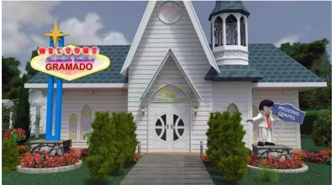
FIGURA 2 – WEDDING CHAPEL