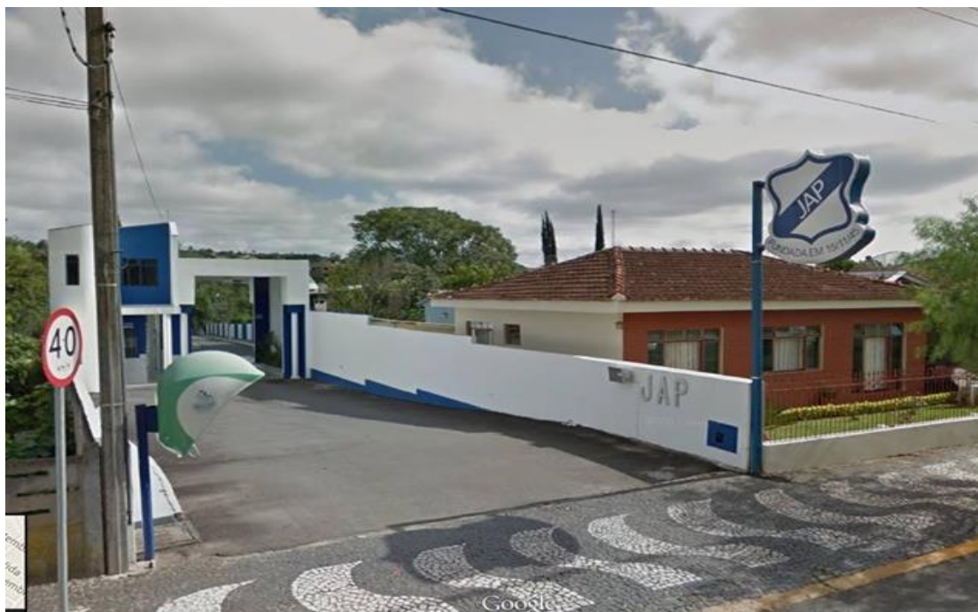
Figura 6 Foto da J.A.P

De acordo com as características em relação ao espaço disponíveis para eventos, citadas pelo Zanella (2008), a J.A.P, tem facilidade de acesso, pontos de iluminação e sonorização, o espaço proporciona vários tipos de montagens, e espaços que possibilitem a diversificação de atividades, o local possui estacionamento compatível com o número de participantes.