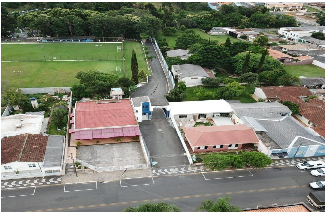
Figura 7 Foto do espaço da J.A.P