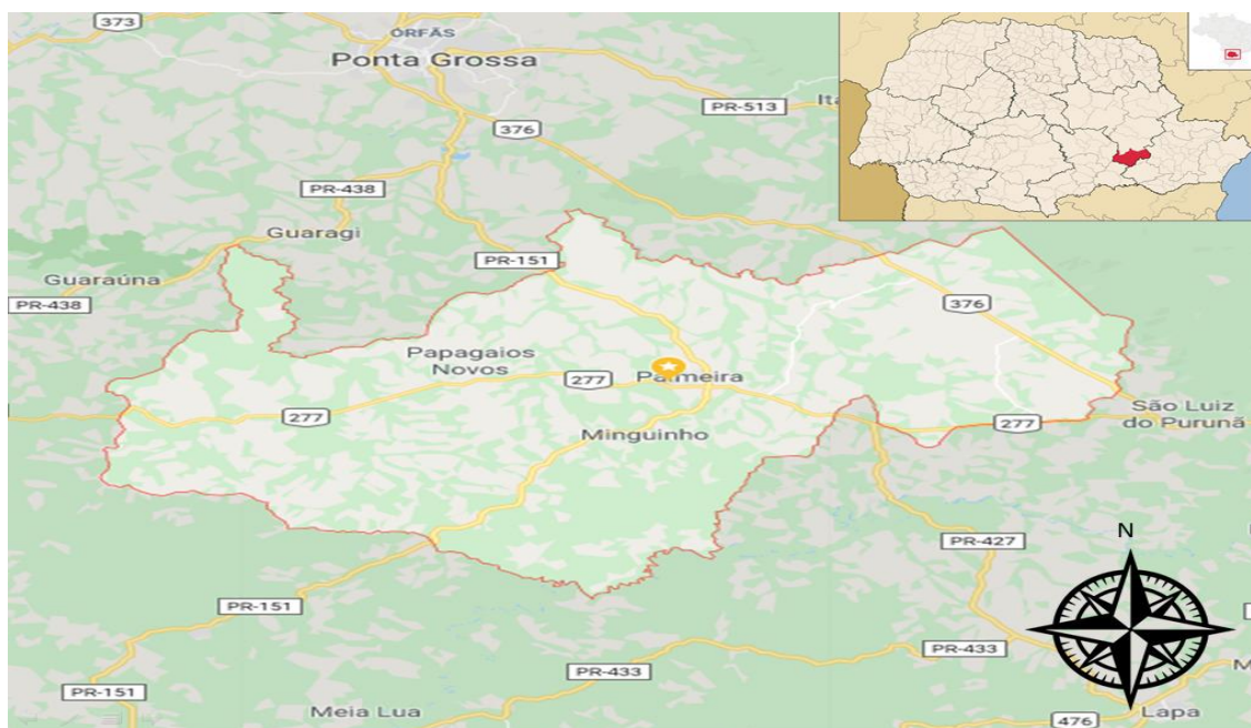
Figura 1: Ilustração da localização de Palmeira-PR

Palmeira é um município brasileiro do estado do Paraná, na microrregião de Ponta Grossa, situa-se a 80 km de Curitiba, a capital paranaense, e 45 Km de Ponta Grossa. Cortada pela BR 277 e pela PR 151, faz divisa com os municípios da Lapa, Porto Amazonas, São João do Triunfo, Teixeira Soares, Ponta Grossa e Campo Largo (IPARDES, 2019).