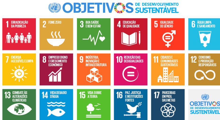
Figura 1 - Objetivos de Desenvolvimento Sustentável