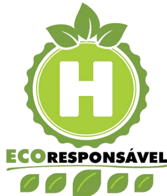
Figura 2 - Selo Eco Responsável