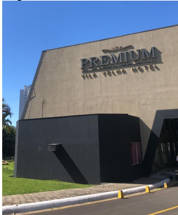
Figura 5 - Premium Vila Velha Hotel