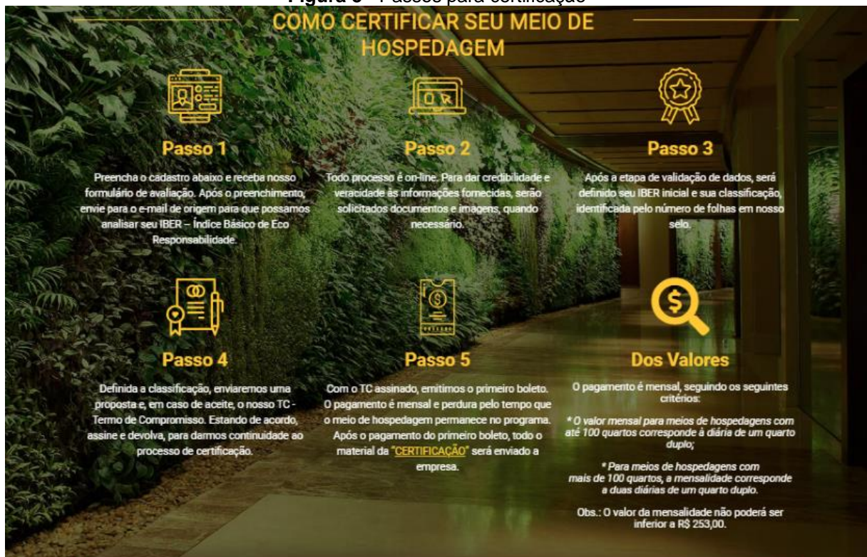
Figura 3 - Passos para certificação

Fonte: Site do Instituto Brasileiro de Defesa da Natureza - Acesso 2022