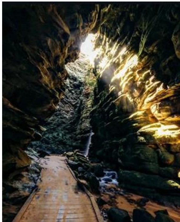
Figura 8 - Entrada da Furna com acessibilidade

Os objetivos que devem ser alcançados ao proteger estas áreas referem-se em “preservar os ambientes naturais (...) com destaque para os remanescentes de Floresta Ombrófila Mista e de Campos Sulinos, realizar pesquisas científicas e desenvolver atividades de educação ambiental e turismo ecológico (BAPTISTA; MOREIRA, p. 198, 2017).