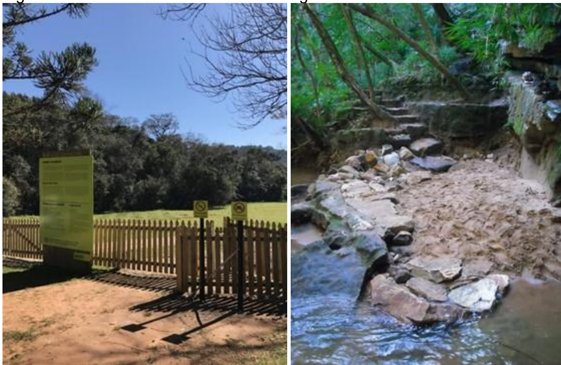
Figura 4 - Início das Trilhas e Áreas de fragilidade