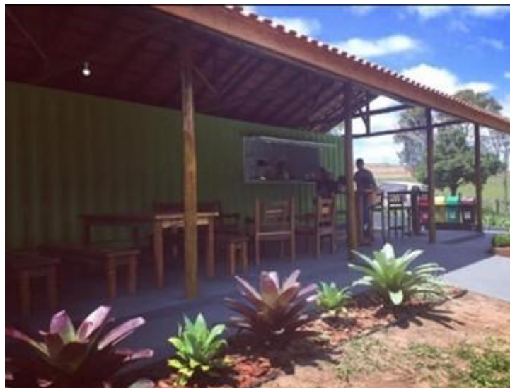
Figura 6 - Antigo café do lobo em 2016