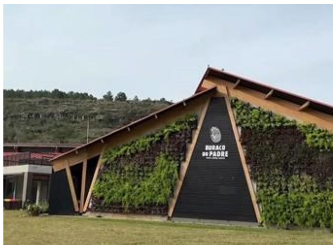
Figura 7 - Geo Restaurante

Atualmente, o parque conta com uma nova infraestrutura de alimentação, o Geo Restaurante (Figura 7), que recebeu este nome por conta da geodiversidade da região. O Geo foi construído e inaugurado no ano de 2024, proporcionando um maior espaço, conforto e variedade de opções em comparação com a antiga lanchonete, atualmente desativada.