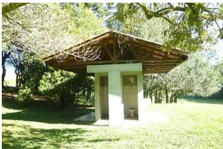
Figura 5 -Sanitários

Também nesse início foi construída uma pequena estrutura com sanitários, que infelizmente era frequentemente vandalizada pelos visitantes (Figura 5).