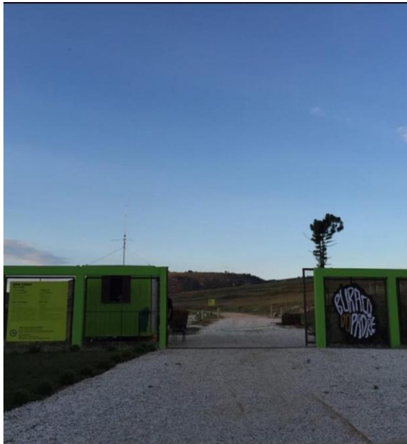
Figura 3 - Antiga entrada do parque pós revitalização em 2015