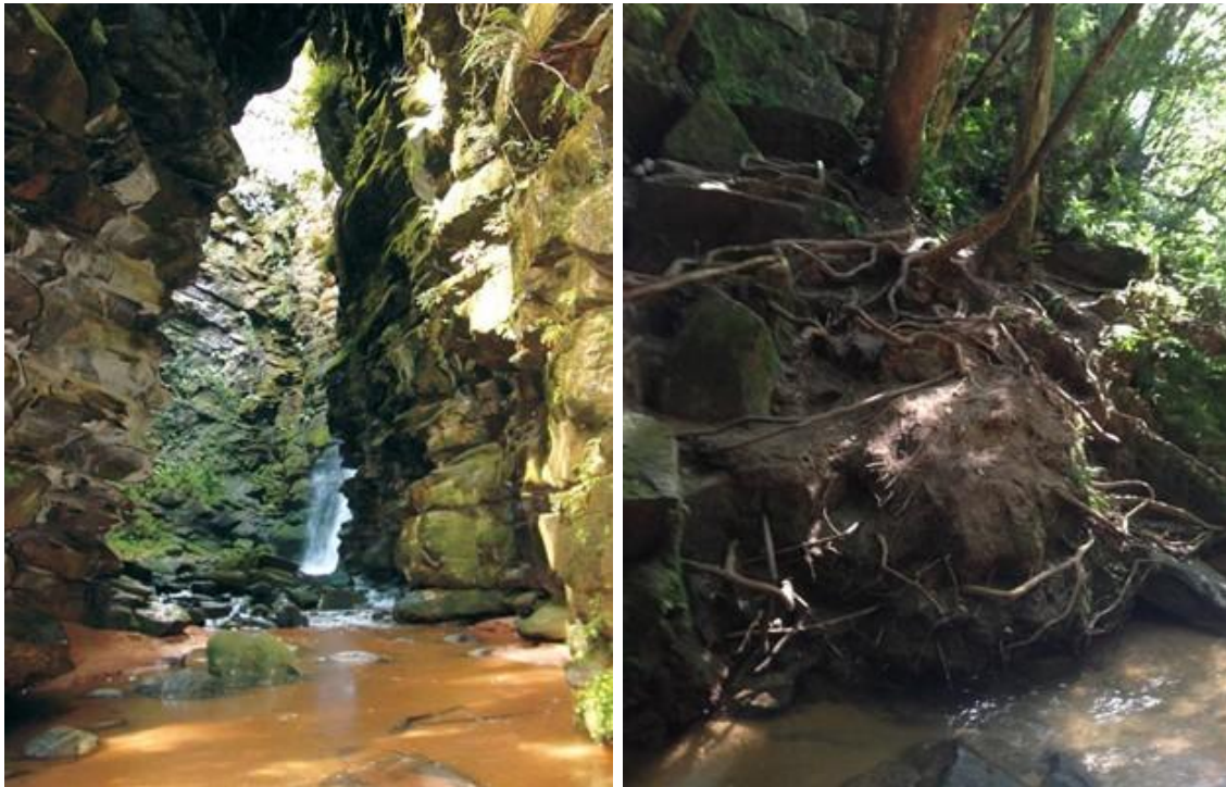
Figura 2 - Condições de acesso à Furna antes da revitalização