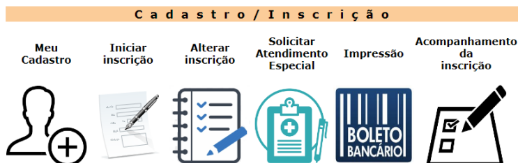
Figura 1: tela de acesso ao sistema