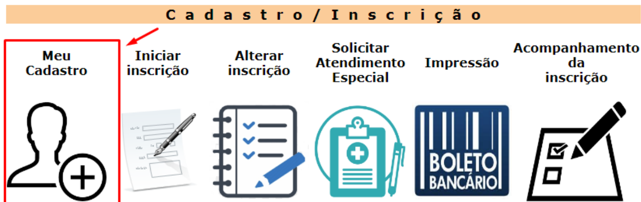
Figura 2: opções disponíveis no sistema

Clique na opção “Meu Cadastro”, em seguida “ATUALIZAR Cadastro”