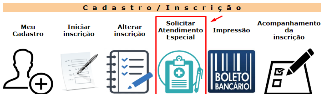
Figura 11: tela de solicitação de Atendimento especial no PSS 2 2023

A pessoa com deficiência pode pleitear atendimento especializado para a realização da prova do PSS 2 2023, no site cps.uepg.br/pss , até o último dia de inscrições, para posterior análise por Comissão designada.