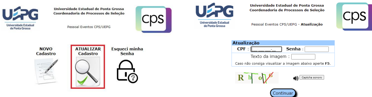
Figura 3: atualização do cadastro

Clique na opção “Meu Cadastro”, em seguida “ATUALIZAR Cadastro”