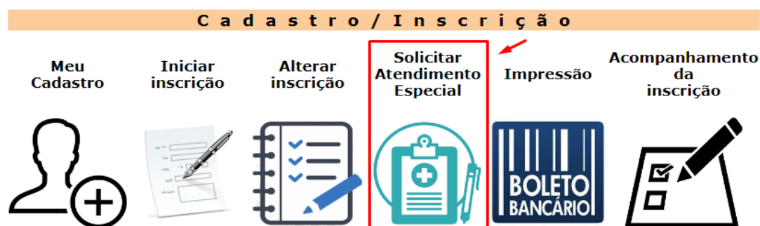
Figura 11: tela de solicitação de Atendimento especial no PSS 3 2024

Caberá à CPS e à PRAE, a decisão de realizar o atendimento especializado em outras cidades, após analisados as limitações e os recursos oferecidos pelo local de aplicação de provas.