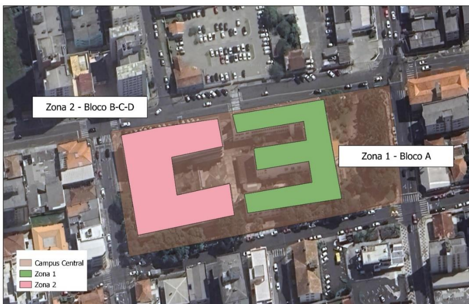
Mapa 1 – Zonas Eleitorais – Campus Central

(A URNA ficará localizada na Entrada traseira do Campus Central, em frente ao Colegiado de Letras)